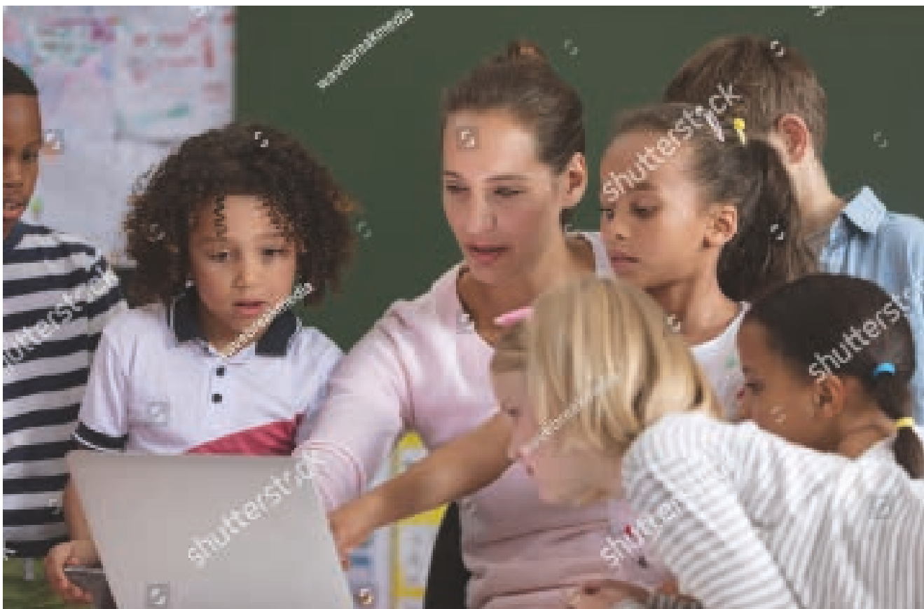
Met burgerschapsonderwijs kunnen leerlingen leren nadenken over sociale verschillen.

in de kerndoelen en leraren zijn er dag in dag uit mee bezig. Veel doelen rondom wereldoriëntatie hebben direct of indirect met burgerschap te maken. Het idee dat burgerschap dus een nieuwe taak voor scholen is, klopt niet. Van scholen wordt vooral verlangd dat ze een integraal aanbod ontwikkelen, gebaseerd op een onderliggende visie, doorlopende leerlijnen en daarmee samenhangende doelen.