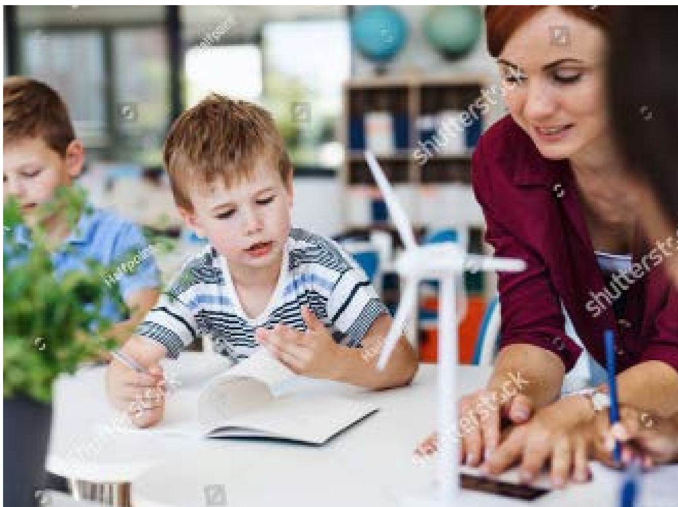
Laat kinderen actief deelnemen aan projecten en nadenken over de verschillende perspectieven bij maatschappelijke kwesties.

lei ervaringen, zeker ook buiten het onderwijs, gevormd. De school kan een wat grotere invloed hebben op burgerschapskennis. Dat is belangrijk omdat kennis samenhangt met aller-