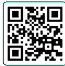
Het nieuwe valprogramma Val OK! Van VeiligheidNL