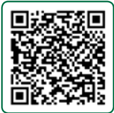
Valoefening 3: "Top: helemaal over de kop!"