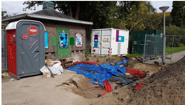
Bekabeling in de Trompenburgstraat, Amsterdam

De artikelen over techniek en technische 3D-innovaties maken duidelijk dat techniek niet voldoende is. Juist dialoog is noodzakelijk om gezamenlijk 3D-beelden of 4D-beelden te vormen. Niet alleen zal een kabel- en leidingenexpert moeten worden geïntegreerd in een ontwerpteam, deze moet ook een positie krijgen die borgt dat de informatie goed wordt meegenomen in ontwerpoverwegingen. Voor de gehele ruimtelijke keten (van visie tot beheer) moet een integrale 3D-ontwerpomgeving worden ingericht die deze dialoog kan faciliteren (Scheffer en Hogeweyj, 2020). Dit vraagt ook om nieuwe organisatievormen, bijvoorbeeld afgeleid van de drie governance-modellen voor informatiemanagement in complexe projecten zoals Erwin Biersteker (2020) ze presenteert. Hierin ligt ook de link naar de borging van de ondergrond in het Digitaal Stelsel Omgevingswet.