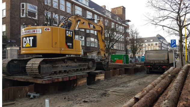
Werkzaamheden aan het riool in de Maasstraat, Amsterdam