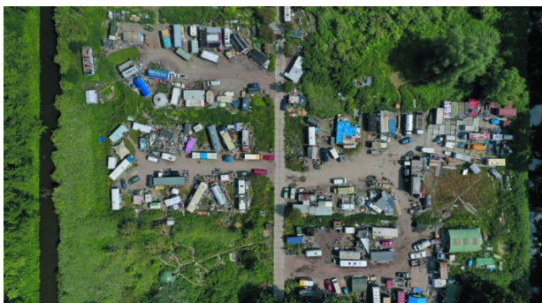
't Groene Veld

In deze context ontstond ruimte om, zoals betrokkenen het beschrijven, "de ADM-gemeenschap te herframen van probleem- naar kansdossier". Waar de focus eerst lag op beheersbaarheid en een nadere ontruiming, besluit het college in de zomer van 2020 om het terrein voor nog eens drie jaar in gebruik te geven aan vereniging De Verademing (opgericht door ADM'ers) en de Culturele Stelling van Amsterdam, die hierbij als kwartiermakers gingen fungeren voor een openbaar toegankelijke, inclusieve programmering. Na een jaar lang inhoudelijke en juridische uitwerking van de plannen overhandigde wethouder Van Doorninck in juli 2021 op symbolische wijze de sleutel voor het terrein. Hiermee leek het eerste grote succes van de Expeditie Vrije Ruimte een feit. Toch kunnen de geplande activiteiten in het najaar van 2021 nog niet van start, omdat de benodigde vergunningen en contracten voor gebruik van het terrein en vastgoed nog niet rond zijn.