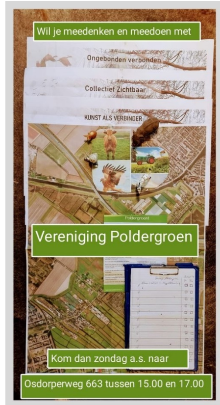
Oproep voor deelname Kavel 663

De verschillen blijken te groot om te overbruggen, waardoor het kernteam in het najaar bezint op een nieuwe strategie. De focus ligt nu op het vinden van een leidend initiatief dat invulling kan geven aan het kavel en hierbij ruimte biedt aan anderen om mee te doen. De initiatiefnemer achter De Kaskantine (hier onder de naam Vereniging Poldergroen) wordt gezien als kanshebber en krijgt enkele maanden de tijd om plannen uit te werken. Gelijktijdig wordt via diverse kanalen gecommuniceerd dat het kavel beschikbaar is. Eind 2021 was nog niet bekend met welke partij definitief verder wordt gewerkt.