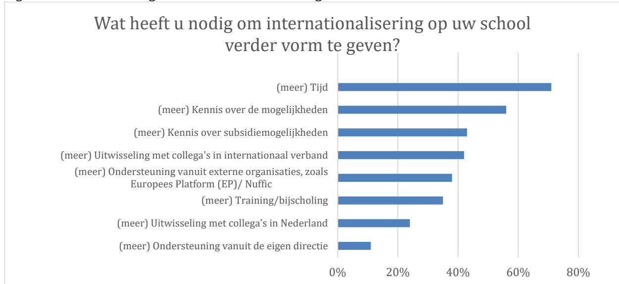
Figuur 3. Verder vormgeven internationalisering

In de enquête is ook gevraagd wat er nodig is om internationalisering verder vorm te geven. De resultaten staan in figuur 3.