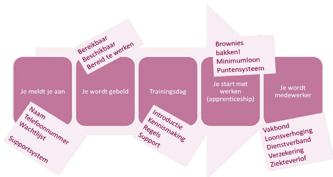
Figuur 1: Open Hiring™-processtappen

Grofweg zijn er vijf fases of stappen in het proces van Open Hiring™ (zie figuur 1):