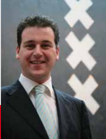
Lodewijk Asscher - Wethouder Jeugd