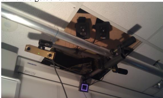
Figuur 2: Beginnend links zien we met de klok mee de stereo camera, de twee infra-rood camera's en de time-of-flight camera

In Figuur 2 worden een aantal van deze camera's getoond.