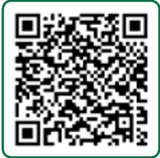
Valoefening 2: "Vuurwerk knallen met achterover vallen."