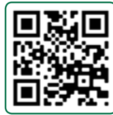
Het nieuwe valprogramma Val OK! Van VeiligheidNL