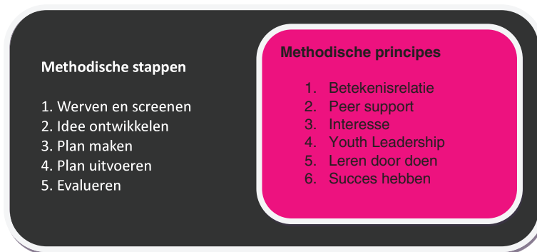
Figuur 2: Methodiek Youth Organizing

uitgangspunten. Dit zijn namelijk de uitgangspunten die ten grondslag liggen aan het methodisch handelen van de sociale professionals in contact met doelgroep. De reden om het handelen te vangen in uitgangspunten (in plaats van in interventies of in richtlijnen) is dat het jongerenwerk zeer dynamisch is: het verschilt per situatie wat nodig is en het verschilt per jongerenwerker hoe een bepaalde handeling vorm krijgt (Metz, 2016; Metz & Sonneveld, 2012). De methodiek Youth Organizing kenmerkt zich door een vijftal methodische stappen en zes methodische principes. De vijf methodische stappen verwijzen naar de volgordelijkheid van handelen. De methodische principes geven inhoudelijk invulling aan het contact dat jongerenwerkers hebben met jongeren. Onderstaande figuur (2) vat de methode samen: