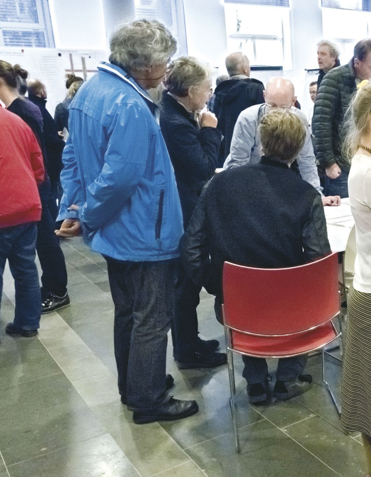
Medewerker stadsdeel Oost in gesprek met buurtbewoners tijdens een informatieavond over groot onderhoud (zie hoofdstuk 12).