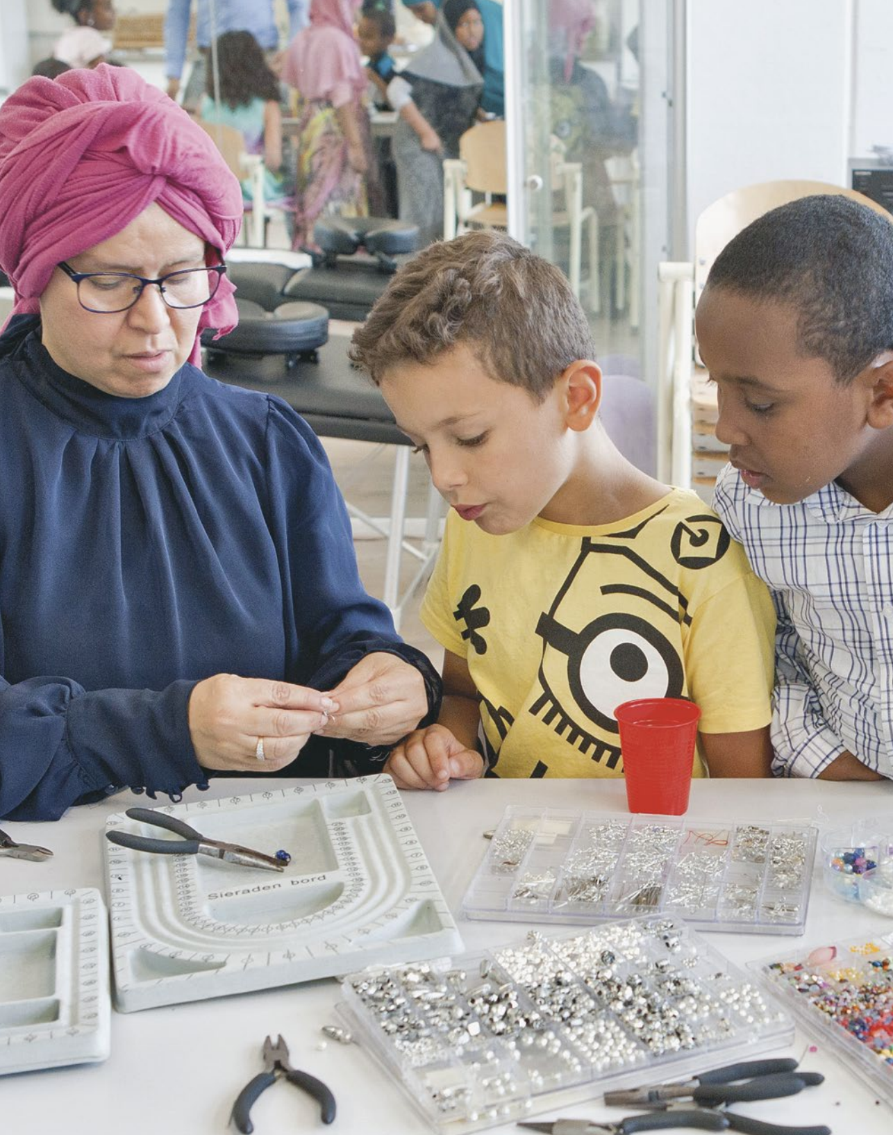
Vrouwen van het Makersnetwerk leren kinderen oorbellen en kettingen maken in de Lucas Community aan de Garage Notweg in Amsterdam Nieuw-West. De Lucas Community biedt ruimte aan verschillende ondernemingen, zogenoemde