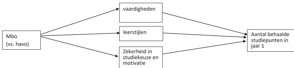
Figuur 1. Mediatie model: Vooropleiding in relatie tot studiesucces, via vaardigheden, leerstijlen, studiekeuze en motivatie

Figuur 1 geeft het onderzoeksmodel grafisch weer.