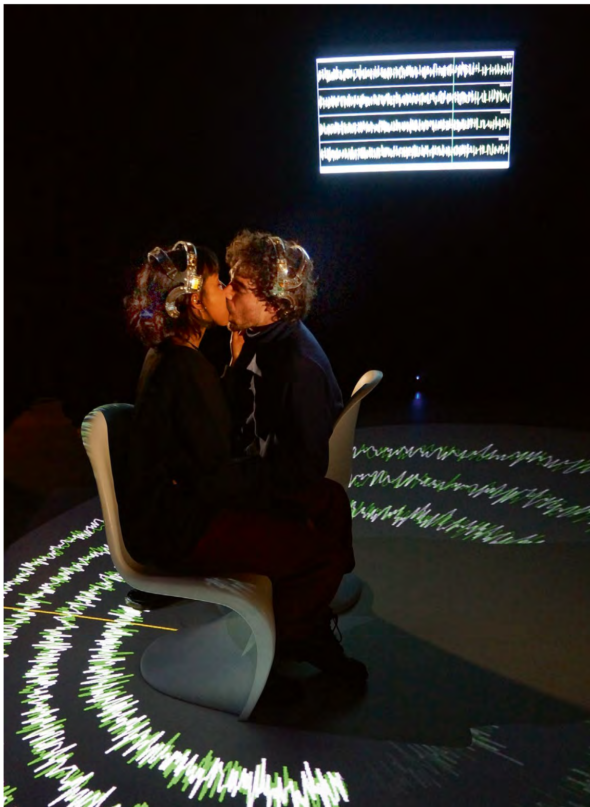
E.E.G. KISS - Lancel/Maat (2018 doortopend). Performance en installatie.