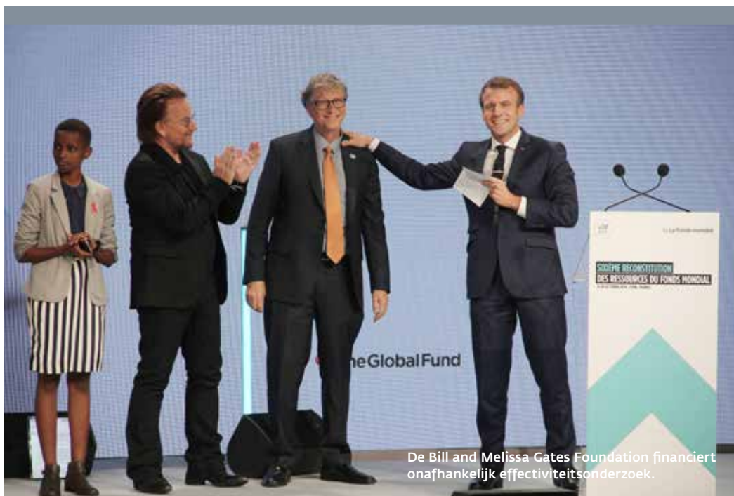
De Bill and Melissa Gates Foundation financiert onafhankelijk effectiviteitsonderzoek.