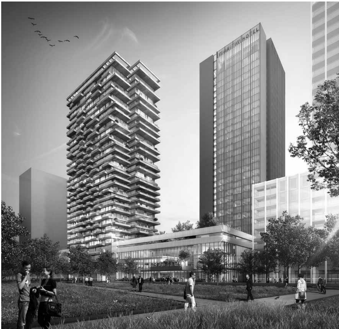
Figuur 3 Congresshotel en woontoren Overhoeks

Eind 2013 tekent het herstel van de woningmarkt zich langzaam maar zeker af. De vraag naar de gemeentelijke ontwikkellocaties in Overhoeks is groot. Ook de vraag naar zelfbouw in Buikslooterham overtreft alle verwachtingen. Woningcorporaties en andere grotere partijen met posities in het gebied gaan ook weer actief plannen voor ontwikkeling maken. ING verkoopt begin 2015 haar overgebleven ontwikkelrecht in Overhoeks aan Amvest, na het flexibeler maken van de stedenbouwkundige en publieksrechtelijke kaders door de gemeente. Hiermee kan ook in dit gebied een doorstart worden gemaakt. In 2014 spreekt het nieuwe