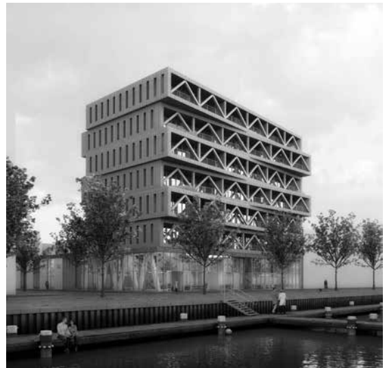
Figuur 2 Patch 22, winnend ontwerp van de duurzaamheidstender die de gemeente uitschreef voor woningbouw in de Buiksloterham (bron: Lemniskade bv, Frantzen e.a. architecten)

ontwikkeling van de Noordelijke IJ-oevers gestart op initiatief van een stadsdeel. In de luwte van de snelle realisatie van de Zuidelijke IJ-oevers vanaf halverwege de jaren negentig is in Amsterdam Noord de omslag gemaakt van herstructurering van industrie- en havengebieden naar een nieuwe visie, “Panorama Noord”, met woningbouw op de IJ-oever en aansluiting op de regio via onder meer de Noord-Zuidlijn. In de organisatiestructuur starten de werkzaamheden dus onder het stadsdeel Noord (tabel 2). Parallel hieraan kiest oliebedrijf Shell ervoor om haar grondeigendom van 27 hectare in het meest strategisch gelegen deel van de noordelijke oever (direct tegenover Amsterdam CS) te herstructureren. De daar gevestigde onderzoekslaboratoria worden in een nieuw onderzoekscentrum geherhuisvest en de overgebleven twintig hectare van het terrein wordt voor 140 miljoen euro verkocht aan de gemeente, de tot op heden grootste gronddeal van de gemeente Amsterdam en een typisch voorbeeld van het tot dan toe gebruikelijke actieve grondbeleid van Amsterdam. Vanaf deze investering trekt de centrale stad de verantwoordelijkheid voor ontwikkeling naar zich toe. Organisatorisch wordt de aansturing opgelost met een gezamenlijk projectbureau Noordwaarts, dat onafhankelijk van de ambtelijke diensten werkt en wordt aangestuurd door een bestuurlijke coalitie van gemeente en stadsdeel (tabel 2). ING Real Estate is ook onderdeel van de deal en zal op dit terrein de wijk Overhoeks